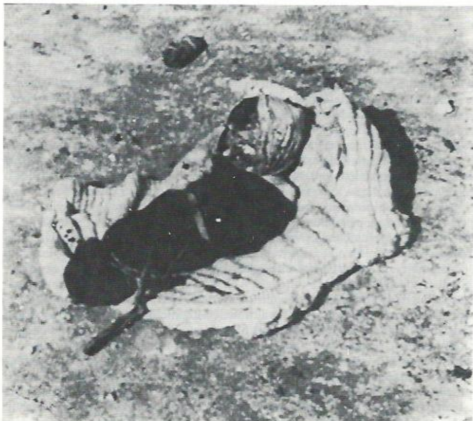
Dei 15.600 bambini trucidati dagli Ustasa v ben 8.000 perirono a Jasenovac

Il campo di cui parla Zlato Levak è quello di Jasenovac, il più grande e tristemente noto dei campi di concentramento della Jugoslavia. Era stato eretto nell'estate del 1942 alla confluenza dei fiumi Sava e Una, dopo un'azione di rastrellamento ordinata dal Ministro dell'Interno Andrija Artuković, il principale responsabile del loro sterminio. "Non era un campo singolo, ma un complesso di sei unità separate. I primi arrivati dovettero loro stessi costruire le recinzioni in filo spinato e le torri di guardia. La maggior parte degli internati non aveva baracche, essendo i prigionieri lasciati dormire all'aperto. Un campo satellite era il Jasenovac ciglana , una fabbrica di mattoni, dove il forno fu più tardi trasformato in crematorio. Un'altra sezione fu destinata ai bambini. Almeno 15.000 vi perirono, molti perché alla loro razione di pane veniva aggiunta soda caustica. I luoghi delle uccisioni erano le rive dei fiumi Una e Sava. Soltanto dalla parte della Bosnia alla fine della guerra furono ritrovati 366.000 corpi. Il numero totale delle vittime è stato stimato attorno alle 700.000, la maggior parte Serbi. Quarantamila Ebrei vi morirono, Quasi la intera popolazione zingara della Croazia e della Bosnia Herzegovina fu assassinata a Jasenovac, assieme a molte migliaia provenienti dalla Serbia. La somma totale si aggira intorno ai 50.000 Zingari, più di quanti ne morirono ad Auschwitz" (Puxon 1985).