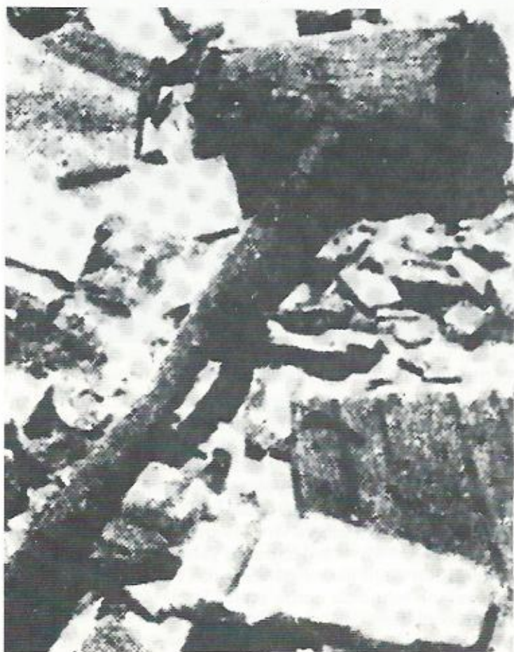
La mazza per le esecuzioni (Museo di Jasenovac)

Ustaša lo hanno ammazzato. Dopo che era morto da una settimana, hanno preso sua moglie e i loro tre bambini. Allora cosa hanno fatto? Questa donna l'hanno presa e l'hanno portata sotto una montagna. 'Fai un buco qui', dicevano. Con una zappa, capisce? Quando il buco era pronto, l'hanno ammazzata e l'hanno buttata dentro. Era anche in stato interessante... Siccome i bambini andavano ogni giorno lì vicino a quel buco e piangevano e chiamavano la loro mamma — dicevano 'Mamma vieni, vieni mamma', allora questi Ustaša hanno visto... e hanno ammazzato anche loro, questi tre bambini vicino alla loro mamma" (Hudorović 1983; 37). "Gli Ustaša imbrogliavano quei poveretti: «Vi daremo case, vi daremo beni, vi daremo da lavorare». E loro poveretti andavano volentieri perché credevano che era tutto vero. Allora andavano finché li avvicinavano al carro bestiame e li li mettevno dentro e li ammazzavano, allora giù. Non sprecavano le pallottole: c'era un ceppo con un chiodo grande; là gli mettevano la testa e paf! un colpo con un grosso martello di legno. E così, poveretti, mezzi vivi, li buttavano nella fossa, una grande fossa che avevano fatto vicino alla Sava. I bambini li buttavano per aria e aspettavano con la baionetta sotto per infilarli. E alle donne tagliavano le mammelle con le baionette. Facevano massacri che..." (Levak 1976; 2).