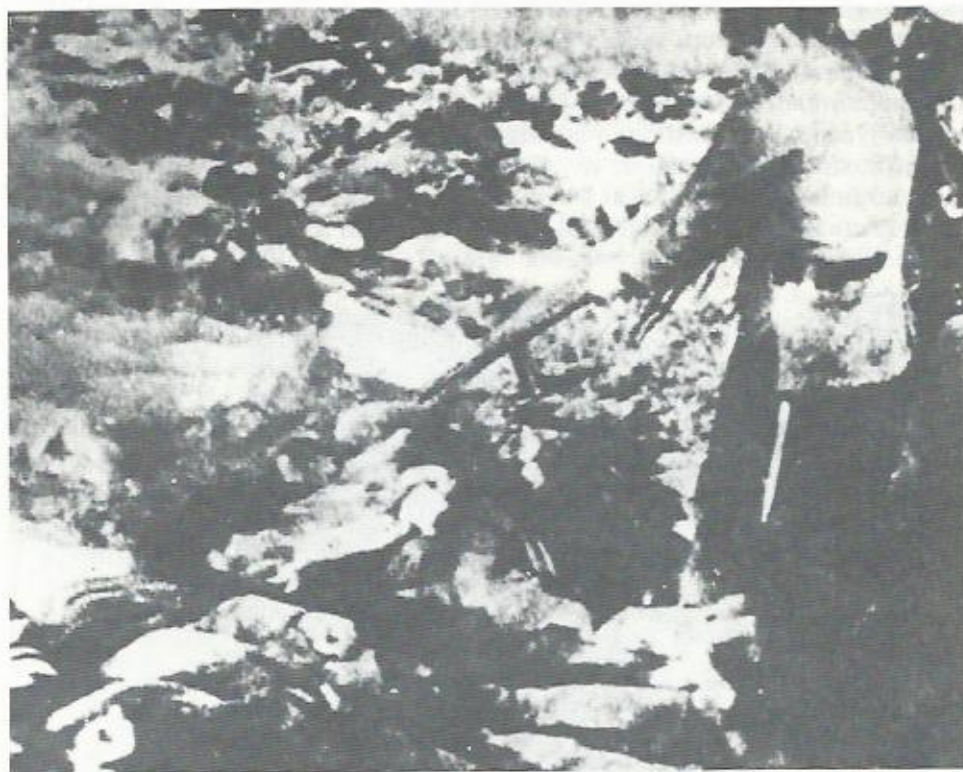
Massacro di massa operato dagli Ustaša a Mlječanica (Museo di Jasenovac)

Ruland (1942; 167) i 280.000 Zingari della Romania, gli 81.000 della Bulgaria, i 275.000 dell'Ungheria, i 116.000 della Serbia costituivano un problema fondamentale, in quanto "rappresentano dall'8 al 14% della popolazione e sono diventati una vera piaga". Il capo dell'amministrazione militare della Serbia, Böhme, fece rinchiodare nel quartiere zingaro di Belgrado, trasformato in ghetto, Ebrei e Zingari quali ostaggi. Altrettanto avvenne a Sabac e Semlen. Così, quando il 2 ottobre 1941 i partigiani uccisero 21 soldati tedeschi, immediatamente il generale Böhme fece fucilare 2.100 ostaggi zingari ed ebrei a Belgrado e a Sabac.